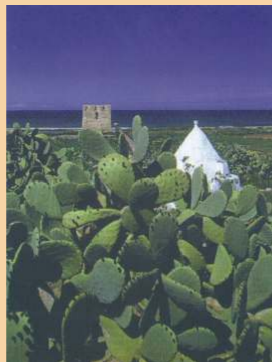
Polignano a Mare, torre costiera