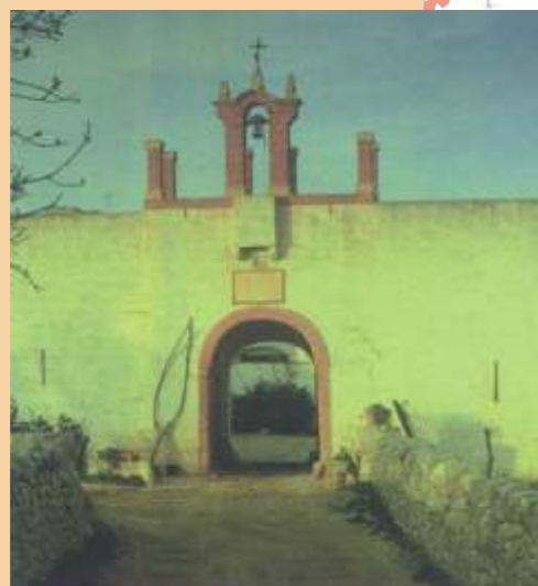
Polignano a Mare, masseria Lamafico