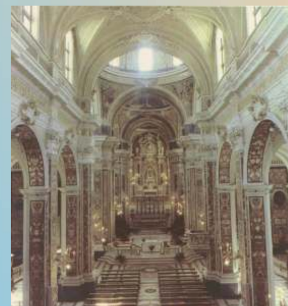
Monopoli, interno della Cattedrale