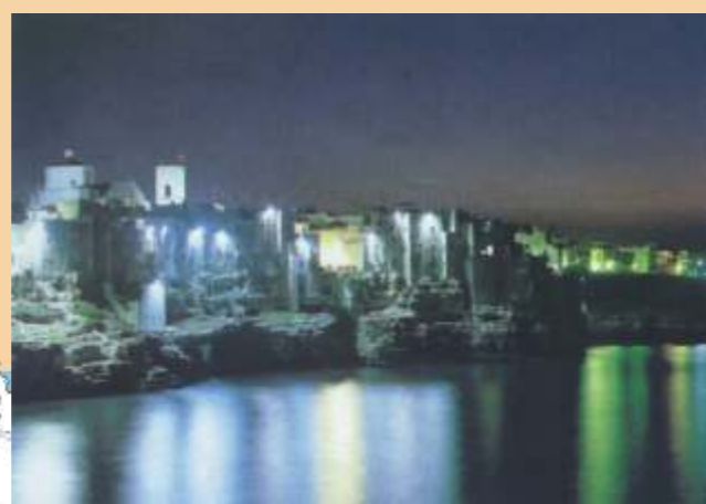
Polignano a Mare di notte