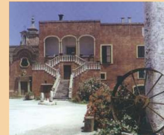
Monopoli, masseria Spina Grande