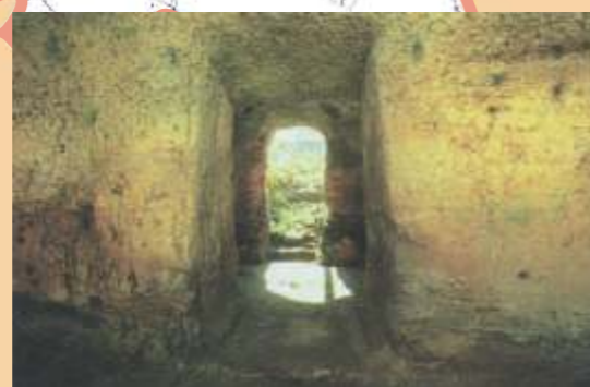
Polignano a Mare, ipogeo Manfredi