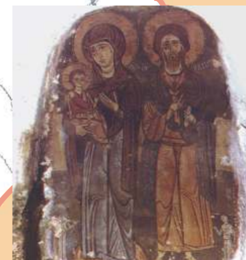
Monopoli, affresco rupestre