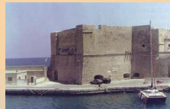
Monopoli, il Castello