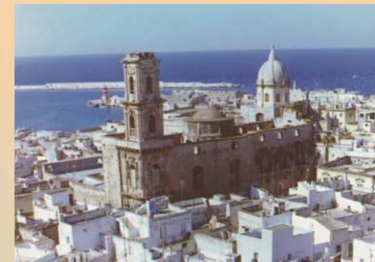
Monopoli, veduta panoramica